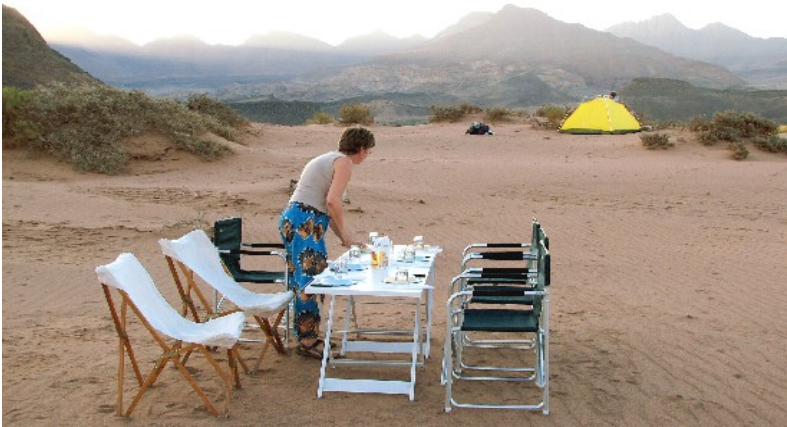
Eine Tagesetappe (ca. 22km) des Kameltreks ist geschafft, das Lager erreicht. Damaraland, Stille pur...

SUNTOURS GmbH Expeditionen · Karawanen · Trekking