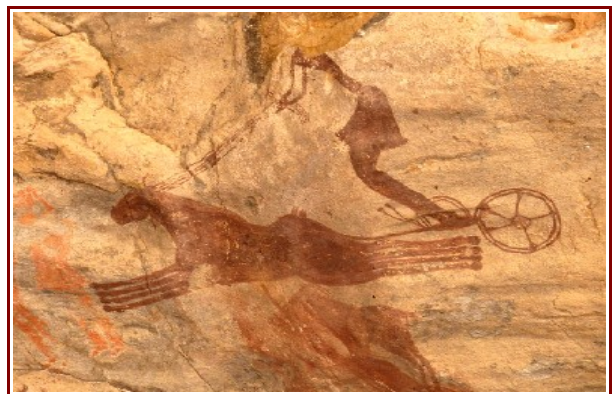
Felsbild, Pferdewagen, Garamantenzzeit, etwa 1000 v. Chr.