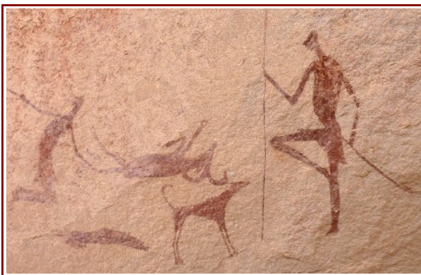
Felsbild, Jäger mit Jagdhund. Die Jagdbeute, ein Moufflon, wird zerlegt