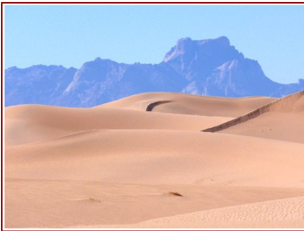
Ergdurchquerung nordöstlich des Gareit el Djenoun. Ein seltener Anblick, der Gareit mit Dünen...

Vierte Pilottour: 19.02.2012 - 04.03.2012 € 2.300,- inkl. Flug 11.03.2012 - 25.03.2012 € 2.300,- inkl. Flug 01.04.2012 - 15.04.2012 € 2.300,- inkl. Flug Weitere Termine im Oktober & November, sowie i.d. Weihnachtsferien