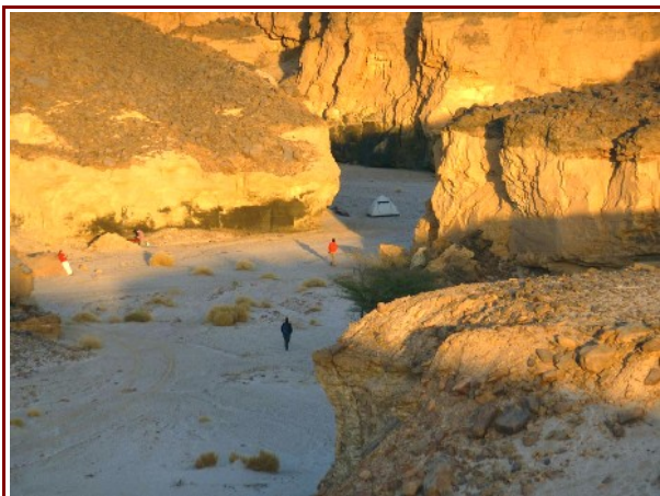
Lagerplatz in einem Canyon, westliches Tassili