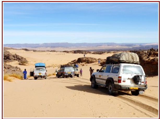
Einfahrt in das westliche Tassili